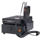
FP-33 指令局用直流安定化電源 デスクトップで指令局として 使用する場合の電源装置。 大型スピーカー内蔵