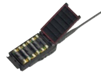
FBA-34 ※2 アルカリ単3乾電池ケース (防水) 乾電池 6 本使用