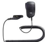
MH-82A7A コンパクトスピーカーマイク 小型で自然な装着感。 3.5φイヤホンジャック付