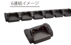
CD-51 ※1 連結型充電器