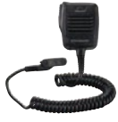
MH-66A7A 防水スピーカーマイク 防滴構造 3.5φイヤホンジャック付