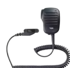
MH-83A7A スピーカーマイク しっかりとしたホールド感。 3.5φイヤホンジャック付