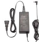
PA-47A 連結型充電器用ACアダプタ