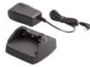
VAC-50A ※1 急速充電器